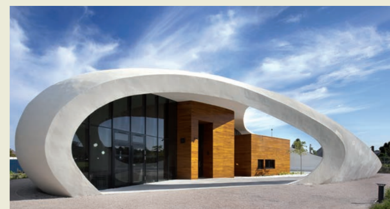
Maggie's Aberdeen