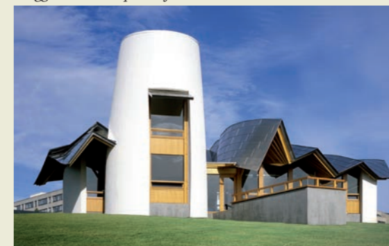
Maggie's Dundee

In questo senso l'armonia di queste architetture ha un potere di cura: la dislocazione degli spazi, i colori, l'arredo, i rapporti di illuminazione, sono tutti elementi che attivano funzioni emozionali, simboliche e di pensiero che possono avere degli effetti su parametri biologici e psicologici, sostenere e arricchire quella "forza spirituale" che è determinante nell'efficacia della cura. «La Bellezza salverà il mondo», scrisse Dostoevskij. E può anche aiutare a curarlo.